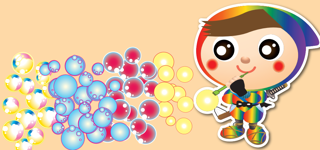
吹き始め→青い玉→赤い玉→黄色の玉

【超連続小玉液】は小玉専用液をベースに配合を変え、増粘剤を強化することで、シャボン玉膜色の変化が楽しめる、驚くほど連続してシャボン玉が出続ける液ができました。